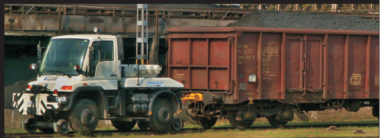
Unimog coby posunovací lokomotiva v Maďarsku