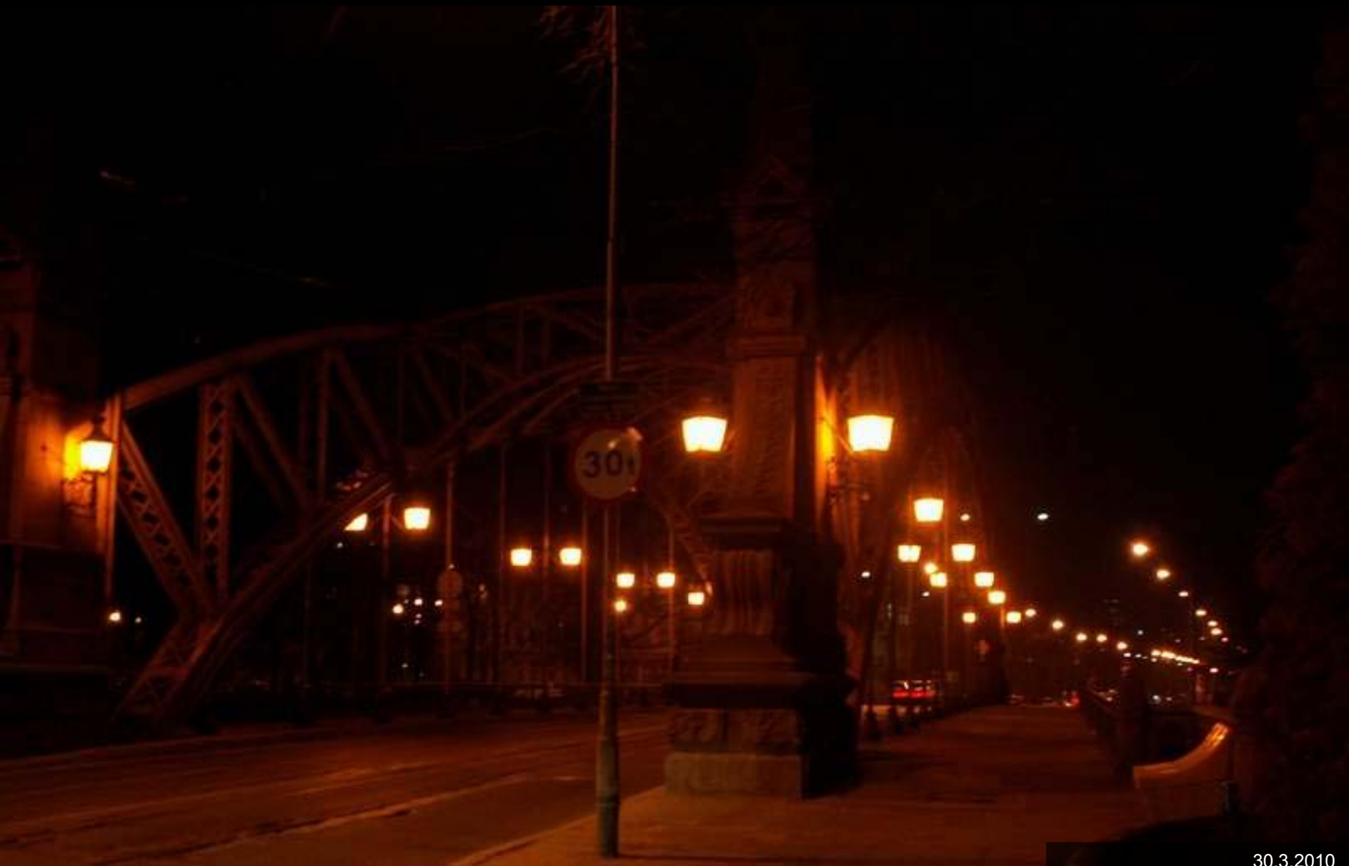
30.3.2010 Zvěřinecký most, Vratislav (PL) Menagerie bridge, Wrocław (PL) Most Zwierzyński, Wrocław