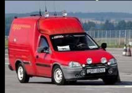
09/2010 Před stříkáním / Before repainting