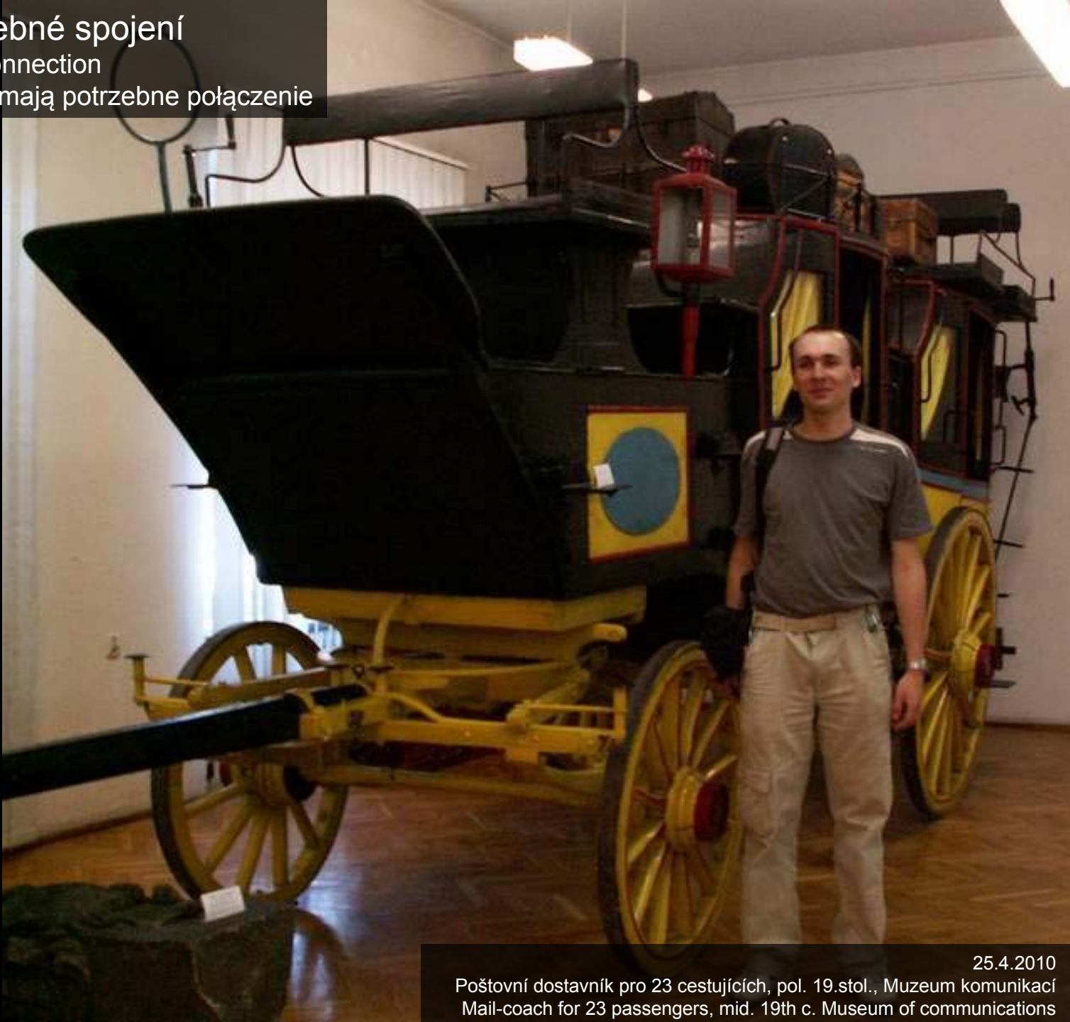
25.4.2010 Poštovní dostavník pro 23 cestujících, pol. 19.stol., Muzeum komunikací Mail-coach for 23 passengers, mid. 19th c. Museum of communications

At' vždy máte potřebné spojení Have always needed connection Niech państwo zawsze mają potrzebne połączenie