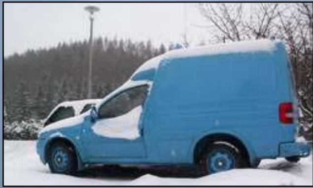
Zimáky / Winter wheels