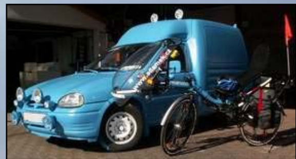
Sladěný vozový park / Consistent rolling stock

Uskutečňujte občas své představy Bring sometimes your imaginations to effect Niech państwo czasami realizują swe wyobrażenia