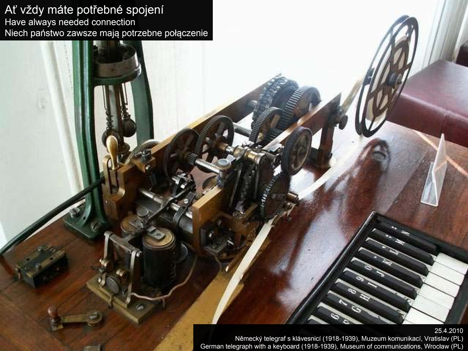
25.4.2010 Německý telegraf s klávesnicí (1918-1939), Muzeum komunikací, Vratislav (PL) German telegraph with a keyboard (1918-1939), Museum of communications, Wrocław (PL)

Ať vždy máte potřebné spojení Have always needed connection Niech państwo zawsze mają potrzebne połączenie