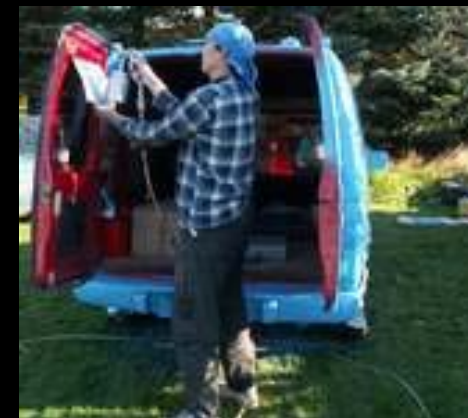
10/2010 Stříkání Comba Repainting of Combo