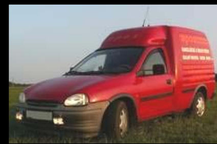
08/2009 Původní stav / Original state