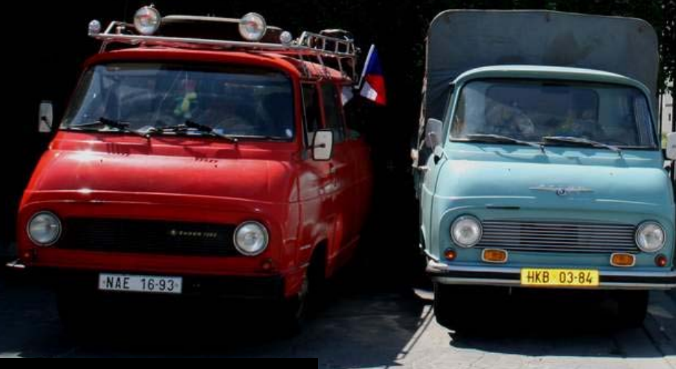
5. 8. 2013, Tmava, SK Bývalý TAZ / Former TAZ / Były TAZ (Trnavské automobilové závody)