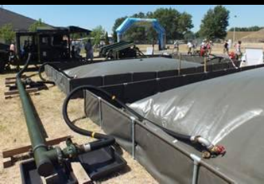
Polní benzínka Field petrol station 2x 25m 3 = 50 000 l