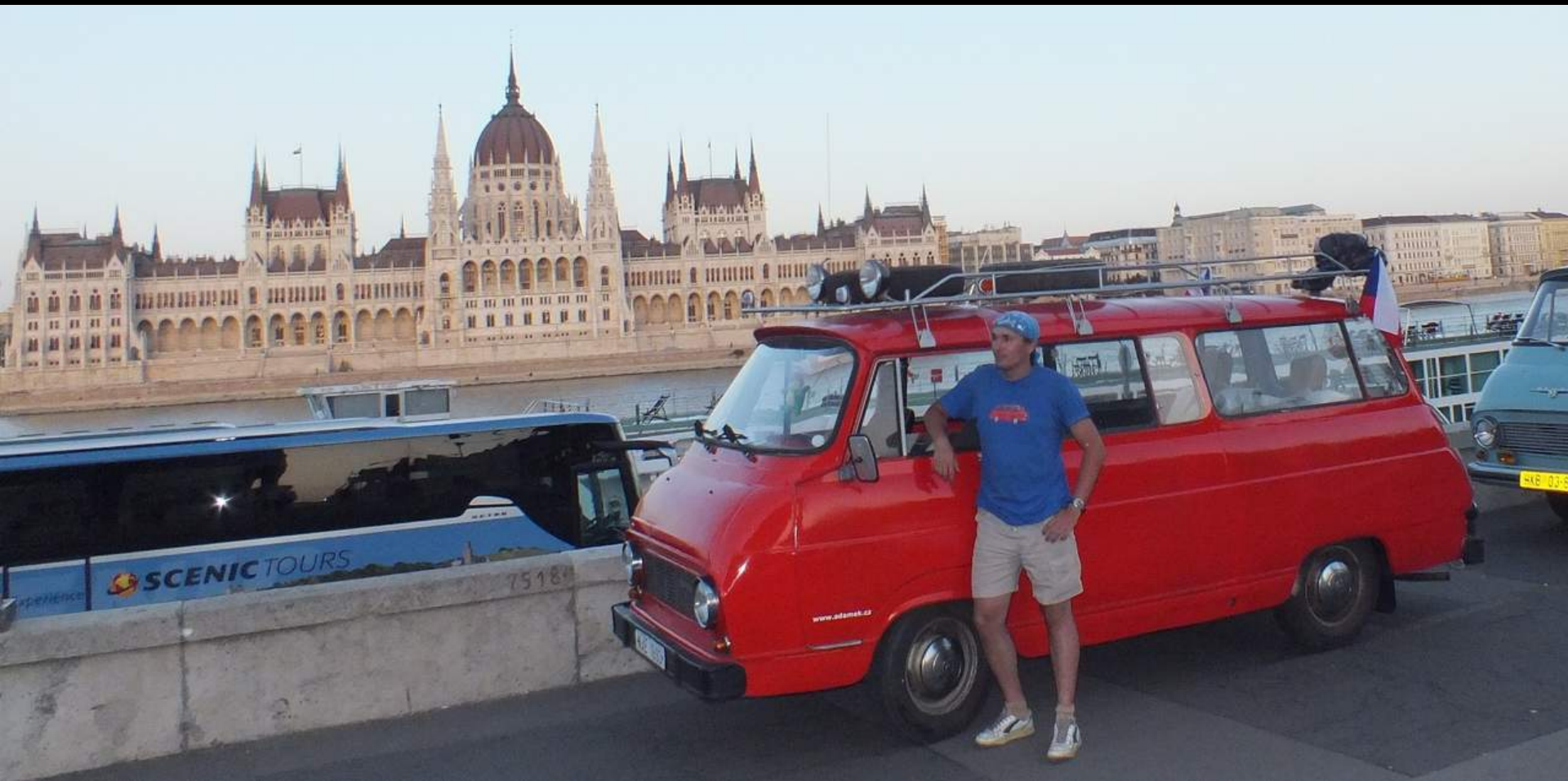
4. 8. 2013, Budapest, H Budapešť – Dunaj a parlament Budapest – the Danube and parliament Budapeszt – Dunaj i parlament