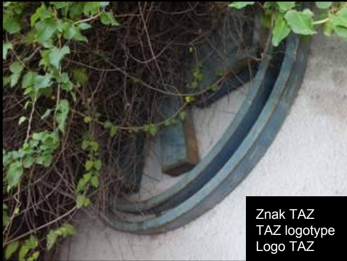
Znak TAZ TAZ logotype Logo TAZ

Niech państwo odbyją pielgrzymkę do korzeni