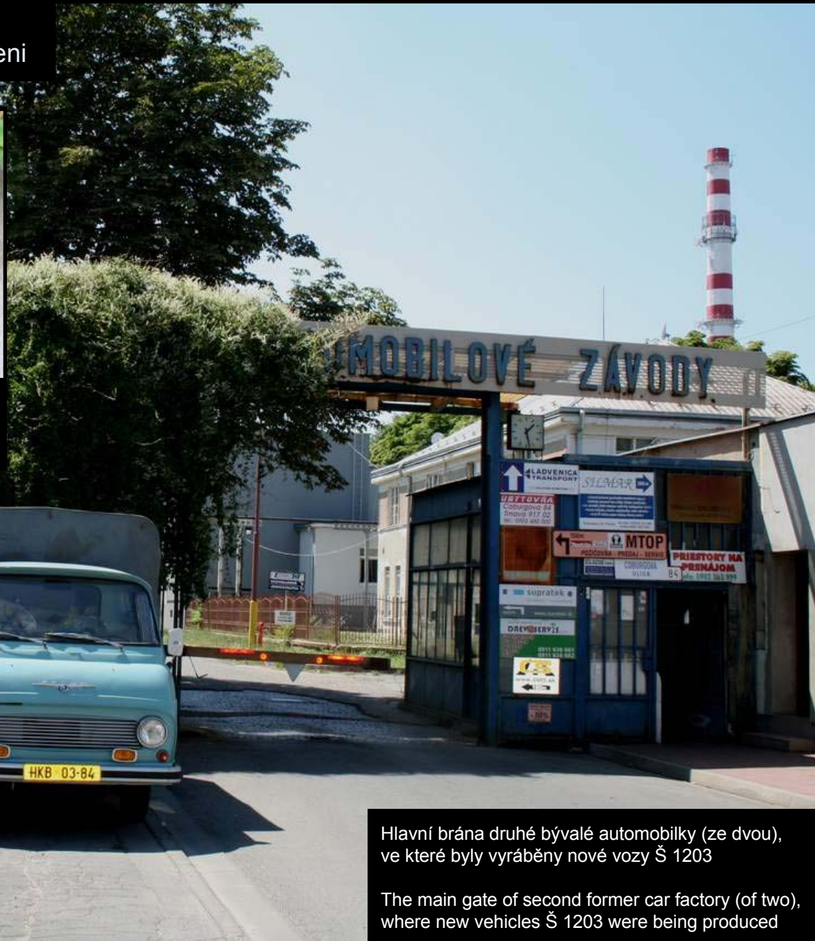
Hlavní brána druhé bývalé automobilky (ze dvou), ve které byly vyráběny nové vozy Š 1203